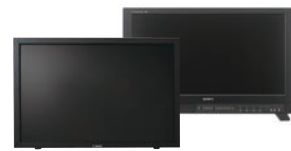
SONY BVM-X300 CANON DP-V3010