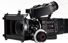
SONY F55 (4K 60p)