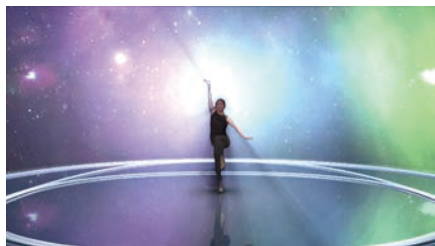
ライトの光源を遮る

ライトシャフト機能により CG 上の光源を被写体が遮ることが可能。 またライトの方向性と被写体の色味の補正ができ、現実に近い映像表現が可能。