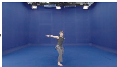
クロマキーバック