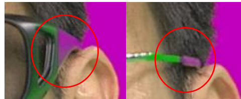
両方ともつやあり